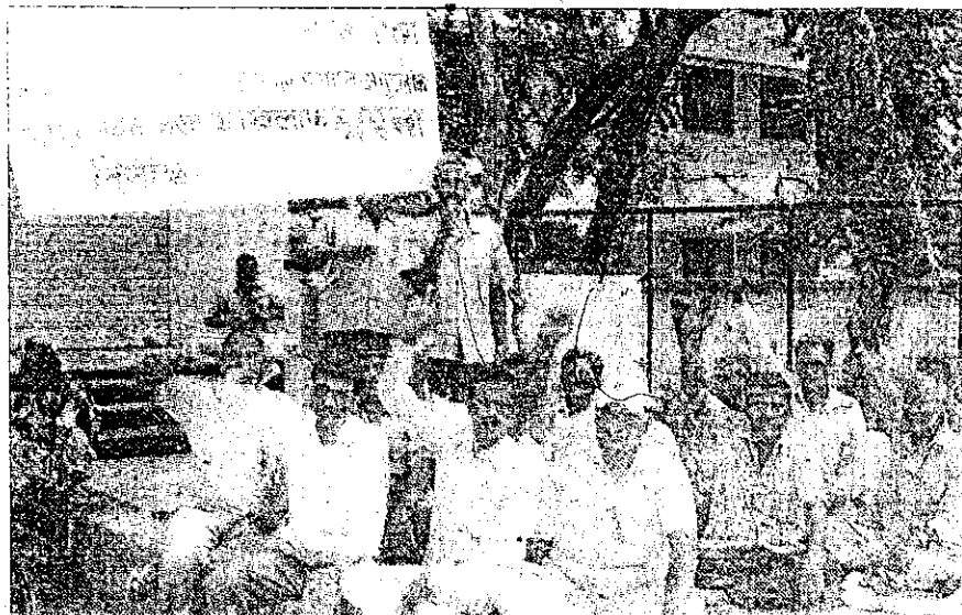
धरना देते कालेज कर्मी ।